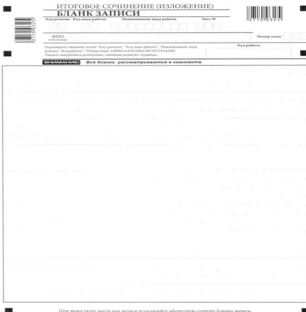
Рис. 5. Лицевая сторона двустороннего бланка записи