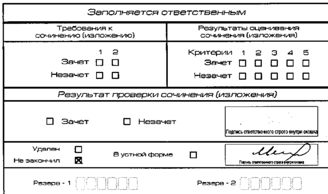
Рис. 12. Заполнение полей нижней части бланка регистрации (завершение написания итогового сочинения (изложения) по уважительным причинам)

В случае если участник итогового сочинения (изложения) по состоянию здоровья или другим объективным причинам не может завершить написание итогового сочинения (изложения), он может покинуть место проведения итогового сочинения (изложения). Члены комиссии образовательной организации по проведению итогового сочинения (изложения) составляют «Акт о досрочном завершении написания итогового сочинения (изложения) по уважительным причинам» (форма ИС-08), вносят соответствующую отметку в форму ИС-05 «Ведомость проведения итогового сочинения (изложения) в учебном кабинете ОО (месте проведения)» (участник итогового сочинения (изложения) должен поставить свою подпись в указанной форме). В бланке регистрации указанного участника итогового сочинения (изложения) необходимо внести отметку «Х» в поле «Не закончил» для учета при организации проверки, а также для последующего допуска указанных участников к повторной сдаче итогового сочинения (изложения) в дополнительные сроки. Внесение отметки в поле «Не закончил» подтверждается подписью члена комиссии образовательной организации по проведению итогового сочинения (изложения) (см. рис. 12).